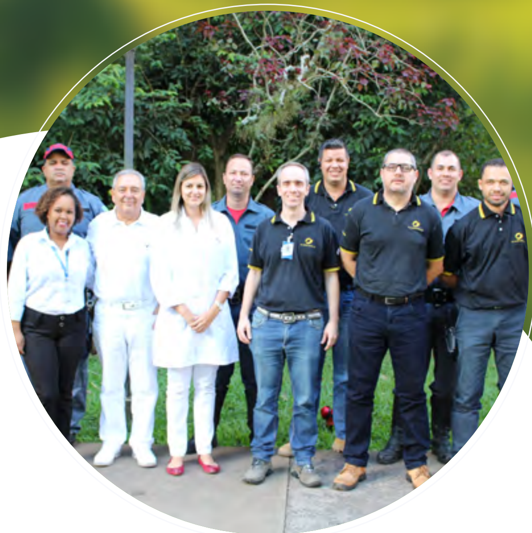
Equipe de HSMT da OJI

Na OJI, Saúde e Segurança são valores primordiais. A empresa investe energia e recursos em uma de suas principais metas: o Acidente Zero. Isso porque são as pessoas o grande motivo para a existência da organização. Garantir que elas tenham saúde, bem-estar e segurança para o desenvolvimento de suas funções também faz parte do papel especial da companhia.