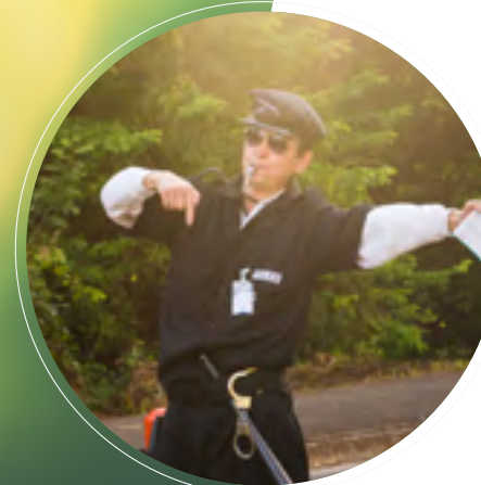
A Participação de voluntários foi destaque na última edição da Sipatma